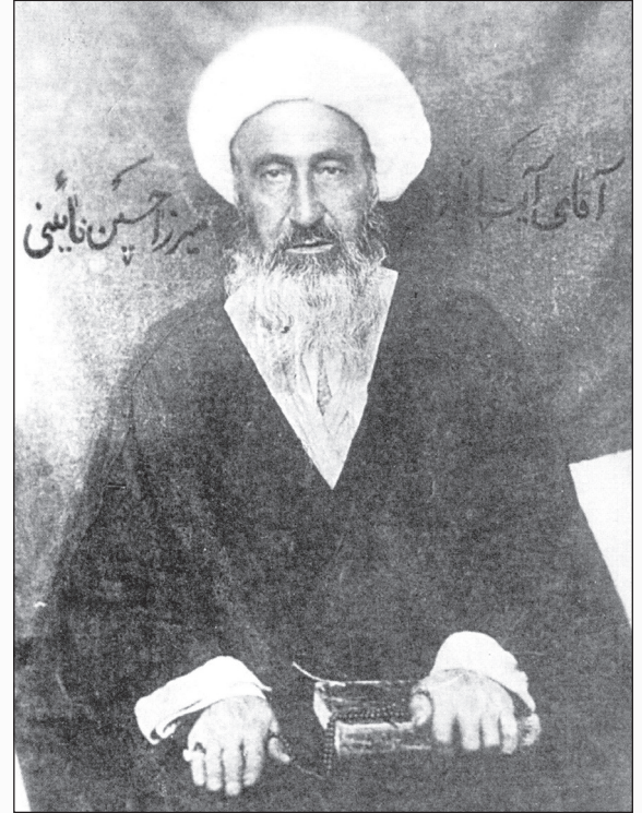
علامه محمد حسین نائینی نویسنده کتاب تنبیه الامه و تنزیه المله

در واقع نظریه ولایت فقیه برای برطرف کردن بحران مشروعت و خلا قدرتی بود که پس از مرجعیت امام، خصوصاً در قیام ۱۵ خرداد ۱۳۴۲ و به دنبال آن لایحه کاپیتولاسیون و حادثه تبعید ایشان (به سبب اعتراض بر ضد این لایحه در سال ۱۳۴۳) به وضوح لمس می شد.